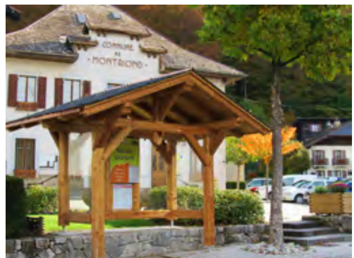
Abribus construit devant la mairie.