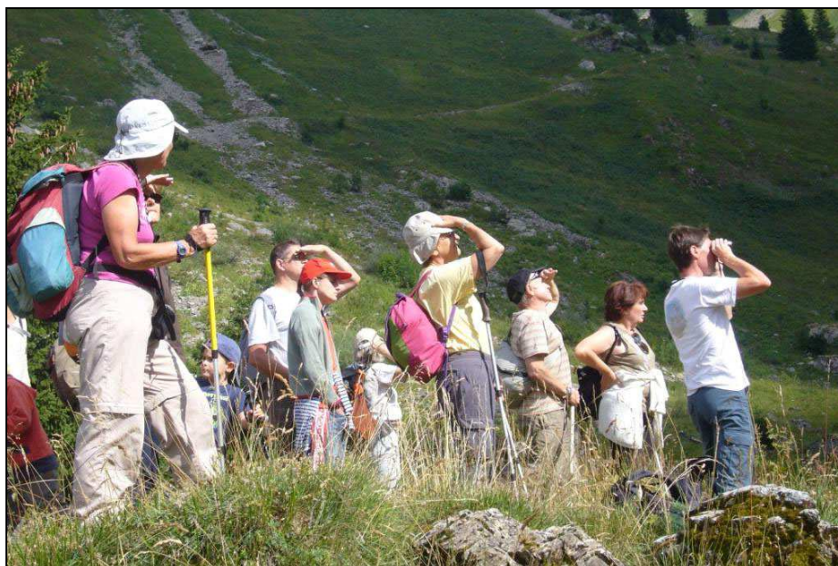
Vallée d'Aulps - Edition 2010

Syndicat Intercommunal d'Aménagement du Chablais Organisation des Itinéraires Alpestres Tél. : 04.50.04.24.24 poste 102 Courriel : ialpestre.siac@gmail.com