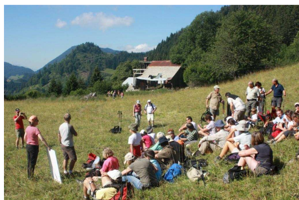
Brevon - Edition 2010

Les Itinéraires Alpestres nous permettront donc de mieux comprendre ce qui nous entoure et voir le Chablais sous un autre jour.