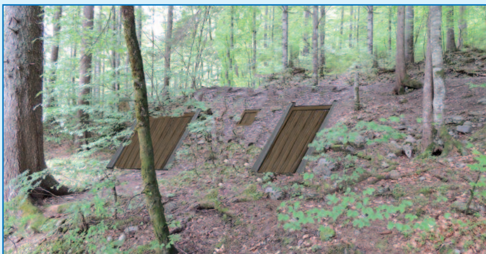
Seules les portes en bois seront visibles en 2015

Ce local sera édifié en bordure de la route forestière, à l'envers du lac, au lieu-dit Les Combes. L'eau permettra de fabriquer de la neige de culture sur la partie basse du domaine skiable d'Ardent. Le local dessiné par le cabinet d'architectes Marullaz de Morzine, répond aux contraintes voulues par la municipalité de Montriond et validées par La SERMA. Le principe retenu est de masquer au maximum ce local technique pour limiter son impact visuel sur l'environnement. Le bâtiment sera enterré et ses parties hors-sol remblayées, les portes en bois resteront apparentes la première année puis seront masquées par une haie végétale. La partie supérieure du local sera recouverte de terre, puis d'herbe, l'ensemble se couvrant de neige l'hiver. Au fil des saisons, ce local se fondera dans le site et passera inaperçu ! Signalons que le chantier de construction du réseau (entre la station de pompage et les enneigeurs) permettra aussi d'enterrer la ligne à haute tension d'Ardent qui disparaîtra donc du paysage (co-financement : SERMA et Commune de Montriond).