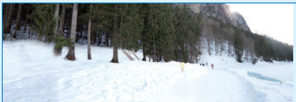
Le local vu du chemin