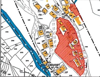
Plan de situation d'origine sans échelle