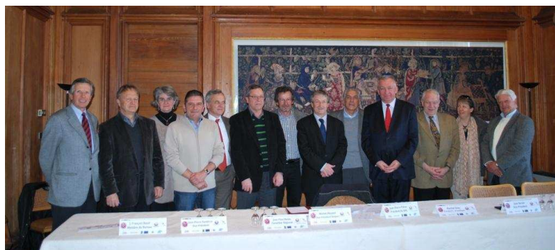
Après l'approbation du SCoT, les élus du Bureau sont très fiers d'annoncer l'intégration du Chablais au sein du réseau des Géoparcs reconnus par l'UNESCO

Géo-tourisme : En tant qu'outil de développement durable, le Géoparc a un rôle actif dans le développement économique grâce au géo-tourisme. Le Géoparc du Chablais met en place une stratégie touristique favorisant l'émergence d'un tourisme durable et va développer des outils marketing s'appuyant sur la charte graphique dédiée. Le projet de géo-route, véritable colonne vertébrale du Géoparc, permettra de comprendre l'histoire géologique à travers 23 sites aménagés et qui seront valorisés en tant que produit touristique. Les Itinéraires Alpestres, action géo-touristique majeure, seront évidemment réitérés en 2012 pour le plus grand plaisir de tous.